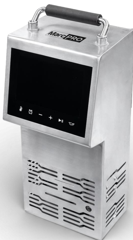
FOTO DO PRODUTO